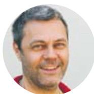
Mats Jäderlund skådespelare