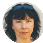
Harriet Nordlund skådespelare