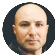
Fikret Çesmeli skådespelare