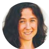
Cecilia Milocco skådespelare