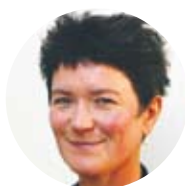
Arabella Lyons skådespelare