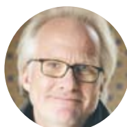
Olle Törnqvist regissör