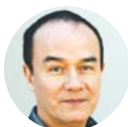
Bai Tao skådespelare